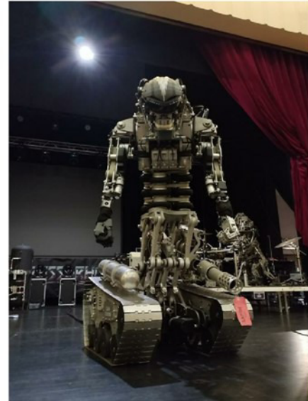
Na festivalih bo letos v svojih delih več kot 50 umetnikov iskalo odgovore na vprašanja o opredelitvi umetnosti, naravi človeškosti in omejitvah tehnologije.