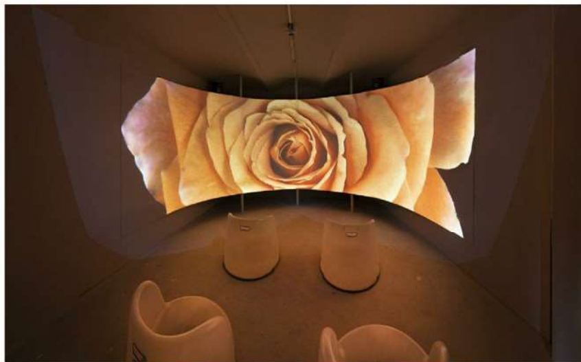
Intermedijska razstava VRTN!CA je sprva zaživela lani v Arboretumu Volčji Potok.

Umrla je Aleksandra Kostič, ustanoviteljica in dolgoletna gonilna sila mariborske Kible