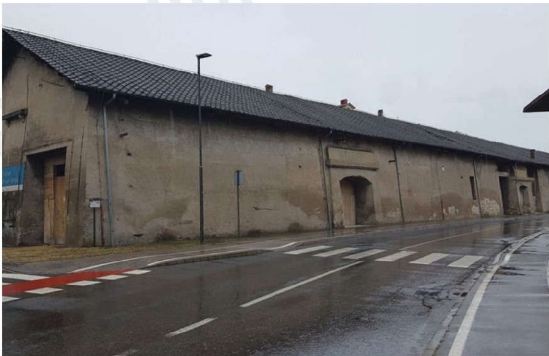
Skladišče Libertas ob koprski severni obvoznici je zavarovano kot tehniška dediščina. V prihodnje naj bi tam redno organizirali kulturne dogodke.