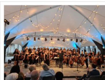
Koncert Simfoničnega orkestra GŠ Krško na brežiškem grajskem dvorišču