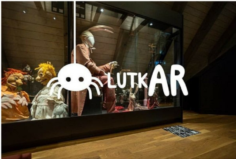
Mreža RUK @Lutkovni muzej Maribor