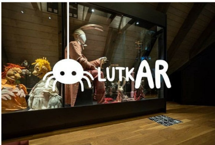
Mreža RUK @Lutkovni muzej Maribor

V Lutkovnem muzeju Maribor lahko preizkusite poučno in zabavno aplikacijo LutkAR