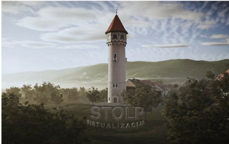
Mreža RUK @Vodovodni stolp Brežice