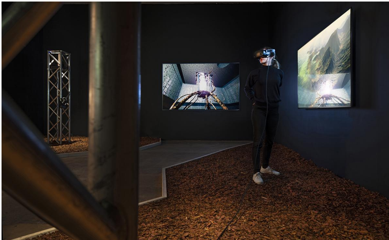
Jakob Kudsk Steensen, Re-animirano, 2018–19, VR in video instalacija.

rtvslo.si/kultura/vizualna-umetnost/razstava-o-virtualnih-svetovih-v-oprijemljivem-ambientu-galerije/586919