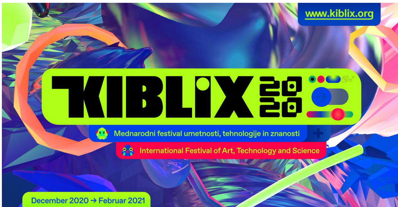
Celostna grafična podoba festivala KIBLIX 2020. Avtor: Dorijan Šiško

V izložbenem oknu mreže raziskovalnih centrov na presečišču umetnosti, znanosti in tehnologije Ruk na spletni platformi bodo predstavili tudi pilotne projekte, ki jih partnerji mreže v sodelovanju z drugimi deležniki projekta izvajajo na osi Trbovlje–Maribor–Koper.