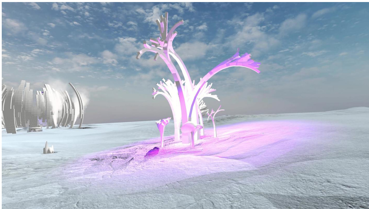
Tanja Vujinović. Sphere3: Infrastruktura, 2020.

Festival, ki bo potekal v online obliki, v središče postavlja vprašanje, kateri in kakšni so virtualni svetovni danes, pravi sokuratorica festivala Živa Kleindienst .