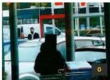
FOTO: V Rušah kradljivec ženski iz rok iztrgal 50 evrov in pobegnil, ga prepoznate?

Iskalna akcija se je končala tragično: 66-letnega Štajerca našli mrtvega