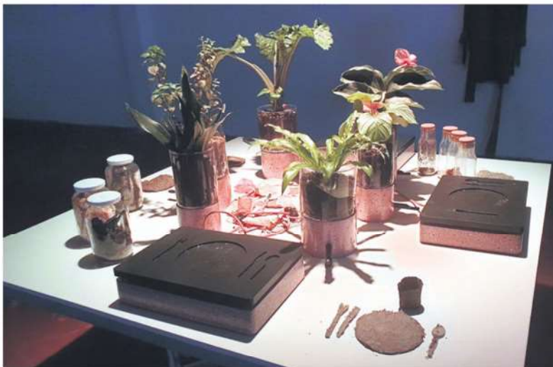
Biorazgradljivi predmeti, izdelek laboratorija HEKA iz Kopra