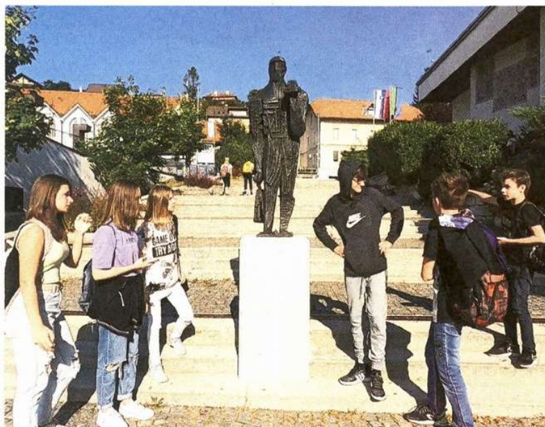
Trboveljski osnovnošolci so posneli film o Prometeju in se sprehodili po njegovi učni poti, ki so si jo zamislili.