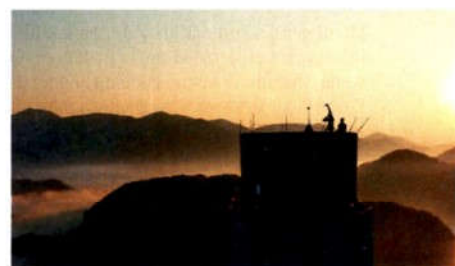
DDTLab / RUK / DDT: Vrtoglavi ptič, 2020 (Speculum Artium)

dvanajsto leto zapored pripravlja festival novomedijske kulture Speculum Artium , ki postaja stičišče idej in kovnica novih rešitev za bodočnost. Z njim nagovarjamo vse, ki svojo bodočnost vidijo v boljšem povezovanju znanosti, tehnologije in umetnosti. ■