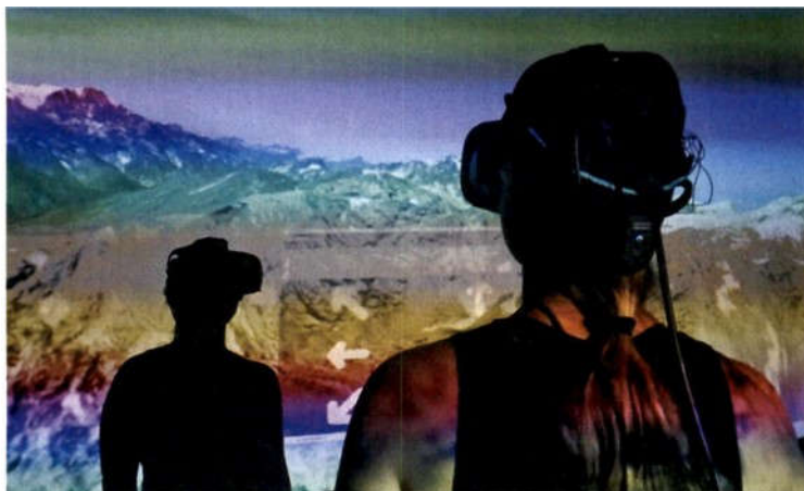
DDTLab / Aformix / RUK / DDT: NeuroFly (Speculum Artium)

dnega gibanja in socialnih stikov, strahu ter ekonomski in drugim negotovostim, ki omejujejo naše delovanje in povzročajo vsesplošno nelagodje v družbi.