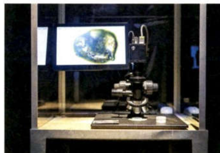
Brad Downey: Nebesna ura / Bodi zdaj tu, 2020 (IZIS)