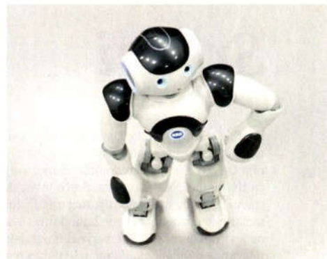
DDTLab / Aformix / RUK / DDT: Eva (Speculum Artium)

Delavski dom Trbovlje, eden največjih kulturnih centrov na Slovenskem, letos že