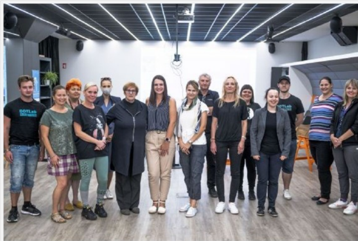
Ekipa S.O.S. šole