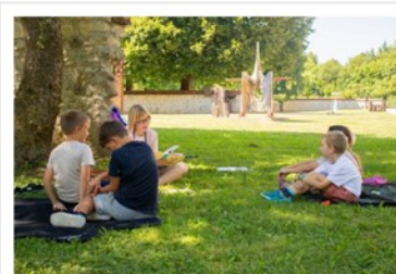
Utrinek z ene poletnih pedagoško-andragoških aktivnosti v galeriji