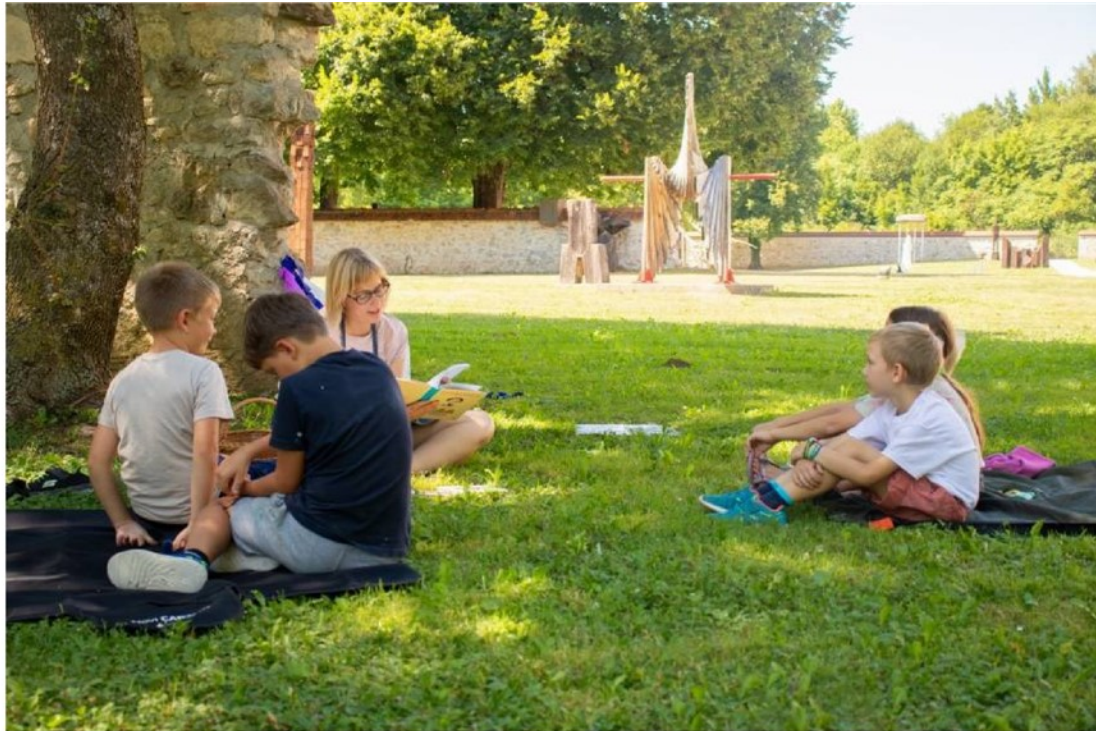
Utrinek z ene poletnih pedagoško-andragoških aktivnosti v galeriji