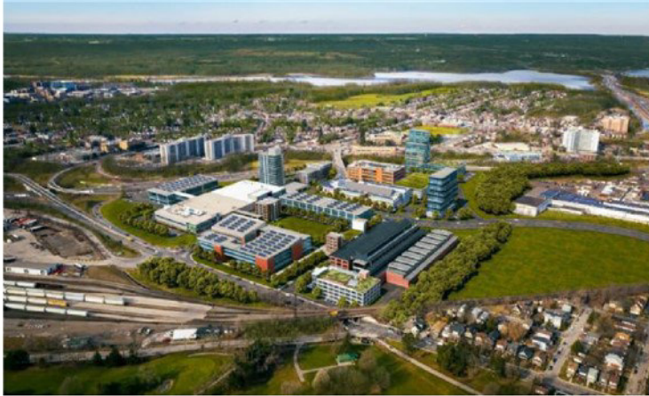
McMaster Innovation Park.

Delaj, živi, igraj se in ustvarjaj: J. Hunt je opisal pomembnost pravega ravnovesja med delom in igro ter kako to vpliva na uspeh inovativnih podjetij.