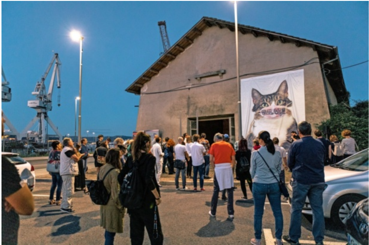
Razstava Fuck of Illusion je v prostore koprskega Libertasa privabila številne obiskovalce. Trenutno je tam na ogled razstava o Tomosu.

Oba omenjena primera, Riba in Libertas, kažeta na to, da je s praktičnimi projekti samoorganizacije od spodaj navzgor možno vzpostaviti alternativne modele prostora, ki delujejo kot oblika kreativne kritike razmer in hkrati kot dokaz, da je možno z aktivnim sodelovanjem na lokaciji spremeniti odnos prebivalcev do okolja tako, da ga ne smatrajo kot danost, temveč da obstaja možnost, da lahko na svoje bivalno okolje vplivajo in ga tudi spreminjajo. Tu velja izpostaviti, da poleg tega, da so začasni uporabniki preprečili nadaljnjo fizično degradacijo prostora s tem, ko so prostor začasno prevzeli, ga delno prenovili in uredili, s svojim delovanjem sprožili tudi spremembe družbeno-prostorskih odnosov in prispevali k dvigu nematerialnega urbanega socialnega in kulturnega kapitala.