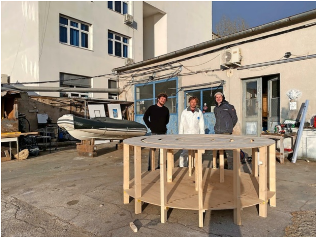
Riba, nekdanji ribiški obrat v Izoli, je postal kreativno vozlišče številnih umetnikov.

Prav v Ribi se je lansko leto pod okriljem festivala Izis rodila razstava Fuck off Illusion, ki je v prostore nekdanjega skladišča soli Libertas v Koprju privabila več kot 800 obiskovalcev iz Slovenije in tujine. Tako se je zapuščeno skladišče soli prebudilo iz dolgoletnega spanca in ponovno zaživel. Glede na to, da je objekt vrsto let stagniral, so ustvarjalci festivala Izis vložili veliko časa in energije, da so ga očistili, pobelili, zakrpal večje luknje na strehi in napeljali provizorično omrežje elektrike po prostoru. Iz prostora jim je uspelo iztisniti maksimum. Lahko bi rekli, da je bila razstava Fuck off Illusion neke vrste stimulator, ki je Libertas rešila pred nadaljnjim propadanjem in nakazala njegovo novo pot. Sedaj v prostorih Libertasa potekata dve razstavi: Tomos in Arhitektura. Skulptura. Spomin. Umetnost spomenikov Jugoslavije 1945-1991. V dveh letih naj bi Libertas postal Center kreativnih industrij. V vmesnem času, do začetka prenove, pa naj bi še naprej služil različnim kulturnim dogodkom. Mestna občina Koper je v danem primeru sprejela in še vedno spodbuja koncept začasne rabe prostora ter je s poskusom revitalizacije Libertasa stopila k udejanjanju te prostorske prakse.