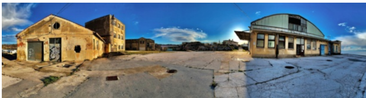
Delamaris v Izoli, v lasti slabe banke Heta Asset Resolution, čaka na princa s čarobno paličico.

Najdlje, pogosto še dolga leta po tem, ko je prava kriza že mimo, pa njene posledice ostajajo vidne v prostoru. Po naših mestih so še danes prisotne sence gospodarske krize iz leta 2007; večinoma v obliki opuščenih gradbišč, nedokončanih nepremičninskih objektov, urbanih praznin in propadajočih investicij ter praznih ali delno zasedenih novozgrajenih poslovnih ter večstanovanjskih zgradb. Ti problemi se s krizo, ki prihaja, samo še stopnjujejo.