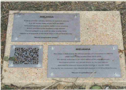
Spominska ploščica v slovenščini in angleščini