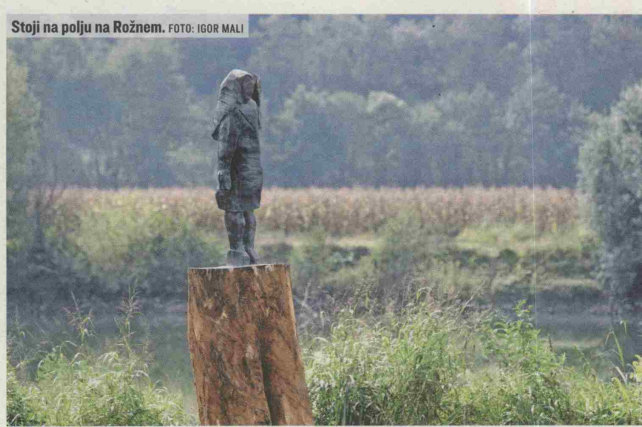
Stoji na polju na Rožnem.