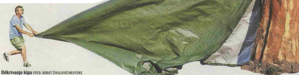
Odkrivanje kipa